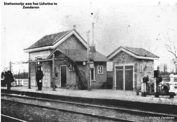
Zenderen, stationnetje Lidwina