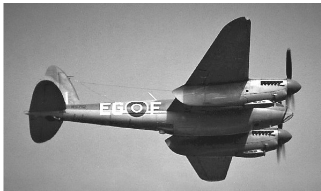
De bommen werden gedropt vanuit een Engelse Mosquito bommenwerper.

Op de straat naar Delden is het een komen en gaan van mensen. In hun zondagse kleren en aangelokt door het mooie weer hebben ze allen één doel: kijken wat de bom heeft aangericht. Het valt me op dat men zo aardig en vriendelijk tegen elkaar is. Het lijkt wel of we op weg zijn naar een kermis of zoiets, denk ik. Misschien is het wel zo dat door het vallen van die ene grote bom, de mensen van het dorp plotseling beseffen dat ze allemaal in hetzelfde schuitje zitten. De bom had overal in het dorp kunnen vallen. Hierover doordenkend word ik er niet vrolijker op, zelfs een beetje angstig. Iedere nacht, denk ik, iedere nacht als ze overvliegen kan het gebeuren, kunnen er bommen vallen, bij familie, bij burens, maar ook bij ons. Ik hoef plotseling niet meer zonedig naar de bom, wil liever niet zien wat voor