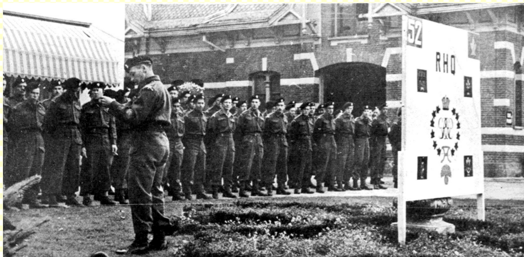
Daags na de bevrijding van Borne worden de posities van de Engelsen overgenomen door de Canadezen. De Royal Canadian Grenadiers vestigen hun hoofdkwartier in Het Witte Huis en soldaten worden ingekwartierd bij verschillende Bornse gezinnen.

Nu kreeg ik in april 2018 een brief van hun dochter en dat ontroerde me zo, dat ik dacht dat moet maar naar Boorn & Boerschop, zodat ik dat misschien naar hun toe kan sturen. Het is ten slotte History!