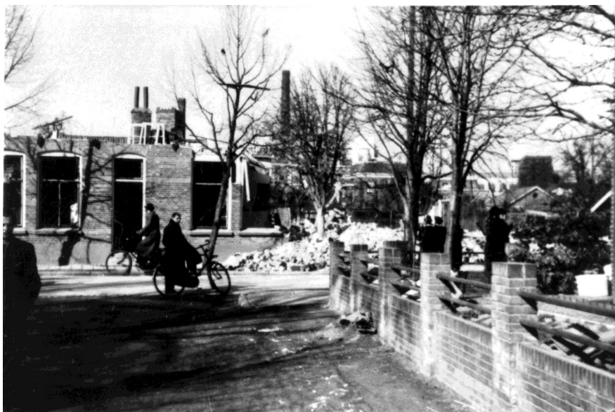
Het derde bombardement in Borne, op 28 februari 1943.

Plots zegt opa, die achter ons aanloopt: "Kiek non es, de jong löp op kousnveut. Waor zolle de kloomp hem laotn?"