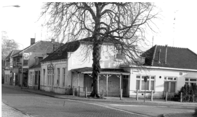
De kastanjeboom bij café Landkroon, gelegen op de hoek van de Stationsstraat en de Dunantstraat.

Dan is het stil, akelig doodstil. Een hoge fluittoon is alles wat ik nog hoor. Doof, ik ben doof, denk ik. De laatste knal was te veel voor mijn oren. Langzaam til ik mijn hoofd op. Er staat een stuk muur van het terras tegen de boomstam. Een brok ervan ligt op mijn hand. Voorzichtig wurm ik mijn hand er onderuit, hij bloedt een beetje. Langzaam draai ik me om, ga rechtop zitten en verwijder het zand uit mijn ogen en oren. En opeens hoor ik mensen schreeuwen. Gelukkig niet doof, realiseer ik me terwijl ik nog trillend van de schrik moeilijk overeind krabbel. Ik kijk naar de straat, die bedekt is met zand en puin. Iets dwingt me om naar opoe te gaan verderop in de straat.