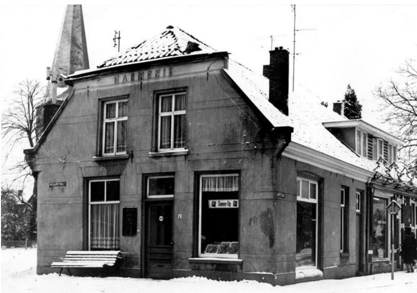
Het pand van Kamman, vrogger ne greunteweenkel. Nu: IJssalon de Harmonie.

Mar noe teruw noa Kamman zien tönneke; zo in het vuurjoar dan zag iej Bennad in de Bakkerssteeg slagmoals met ne paddenschepper gängs um de inhoald tusken de rabarber te streaien. Joa, doar wol 'n rabarber wal van greuien, zo as wiej vanof