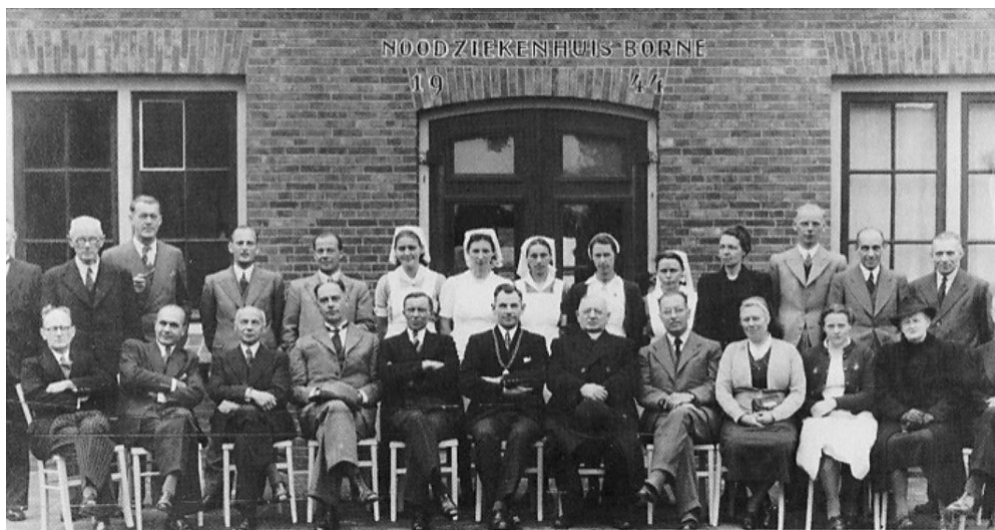
Het personeel, doktoren en (gemeente)bestuurders voor het noodziekenhuis gevestigd in de school in de Pietmanskolkstraat.