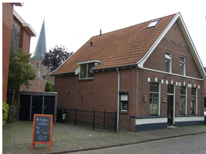
Het voormalige café 't Steertje in de Marktstraat.

In de Nieuwstadsstraat (nu de Marktstraat) lag een brug, zodat het verkeer zowel over de weg als over het water kon passeren. Deze brug heette de Smidbrug, Smidsbrug of Smitsbrug, alle drie de namen kunnen we tegenkomen in de literatuur. Deze naam