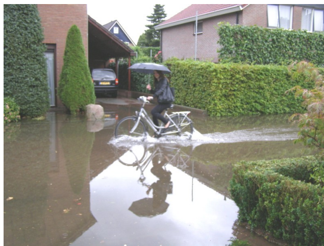
Na een dikke onweersbui kan het behoorlijk nat zijn. De Pinksterbloem staat blank.

Borne is ontstaan aan de oever van de beek op een hoog gelegen gedeelte (Horst), iets verder naar het zuiden dan de vindplaats van de mammoetbotten. Zo gebeurde dat vroeger. Voor vervoer waren er zandwegen die een deel van het jaar onbegaanbaar waren. In 1813 was er in heel Nederland maar 450 kilometer verharde doorgaande weg, in Twente geen enkele kilometer (3). Daardoor was vervoer