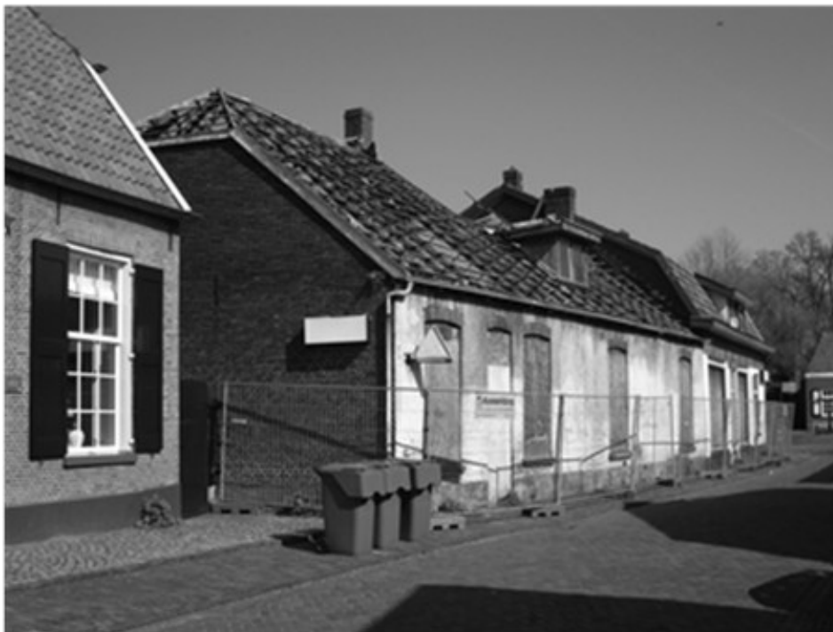
De panden Hasperhoven in 2009.

schakelde een architectenbureau in, dat daarin was gespecialiseerd. Verschillende ontwerpen kwamen op tafel en werden afgewezen. Eerst was het plan om er een artsenpost met apotheek te vestigen. Dat ging niet door, omdat de artsen huisvesting kregen in het zorgcentrum Het Dijkhuis. Daarna werd een ontwerp gemaakt voor de bouw van een restaurant met een paar winkeltjes zoals een galerie, een kaartenwinkel, zilvermid, antiquair of iets dergelijks. Voor het restaurant meldde zich al een gegadigde. Maar dit plan kon rekenen op grote tegenwerking van de buurtbewoners.