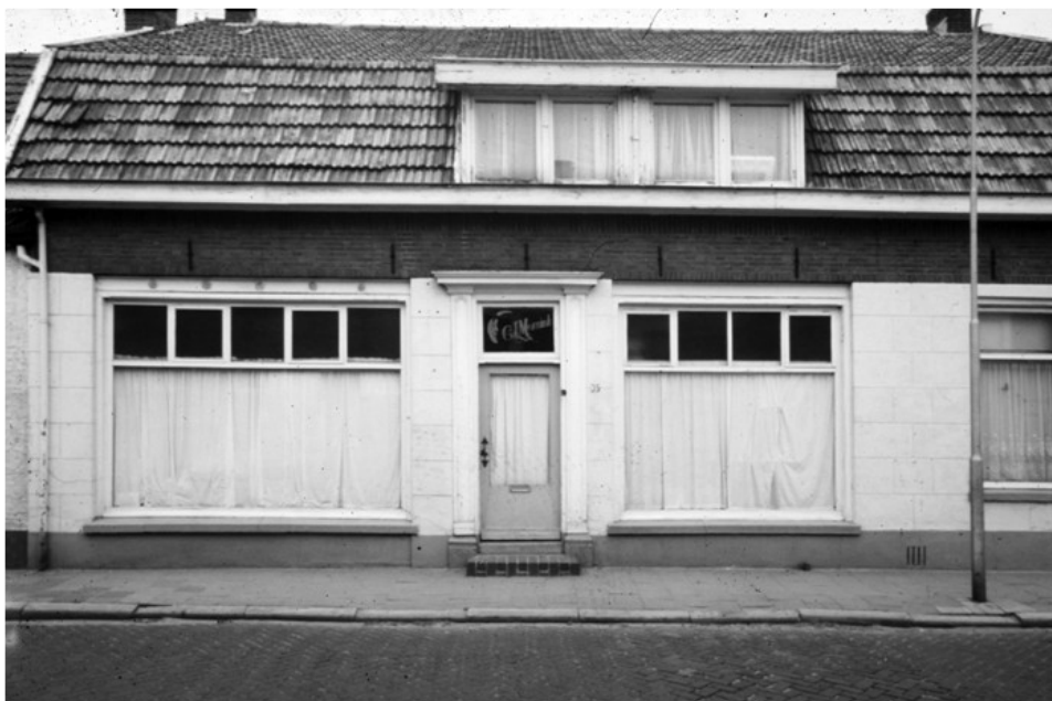
Herberg De Halve Maan.