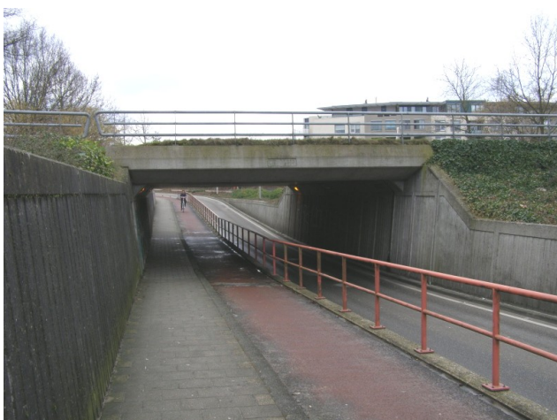
Viaduct 'de Sluis'

Rond het jaar 1660 is de beekbedding die we nu de Bornse beek noemen, om het dorp heen gegraven. Dit schijnt te zijn gebeurd tijdens het bewind van