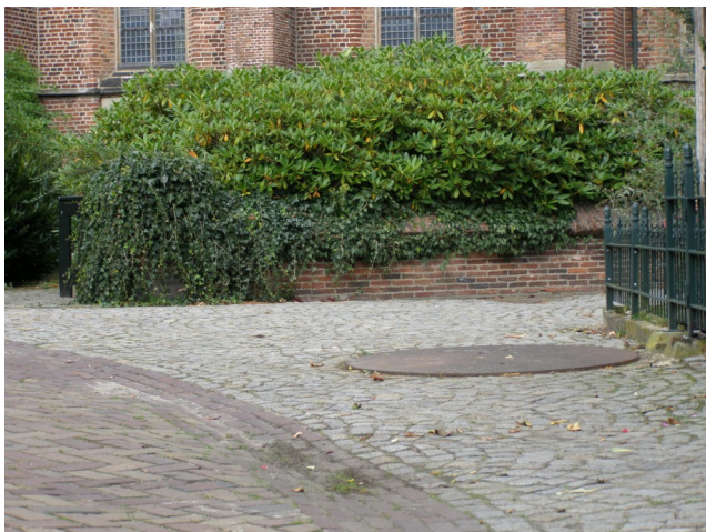
De put in de Oude Kerkstraat, hoek Pellenhof.

De Pietmanskolkstraat verwijst naar een verbreding, een kolk, die hier lag in de Bornse Beek. Waarschijnlijk konden hier schuitjes draaien en aanleggen. Er wordt ook gezegd dat de kolk gebruikt werd om vlas te weken en linnen te wassen (7b). Omstreeks 1835 werd er een dam door de Pietmanskolk gelegd, waarover de Peppelenlaan, de latere