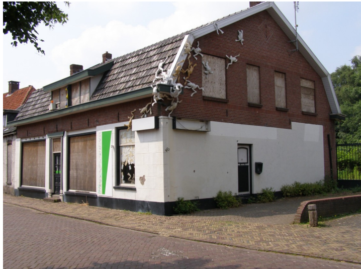
Het pand waar destijds café De Halve Maan en later electronica-zaak Hasperhoven gevestigd waren.

Overigens was het Steertje niet de enige