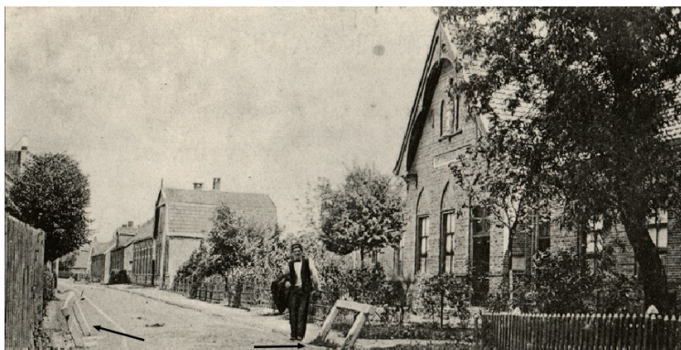
De Ennekerdijk in vroeger jaren. Rechts het St. Josephgebouw (nu Galerie Hallema). Op de voorgrond (met pijlen aangegeven) twee houten brugleuningen.

Op de Kadasterkaart uit 1832 (6) is duidelijk te zien hoe de beek zich door de Zuid Esch slingerde. Ter hoogte van waar nu de