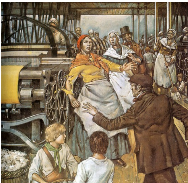
Verbeelding van slechte werkomstandigheden en kinderarbeid in de fabriek.

Deze situatie kan niet blijven voortduren. Vanaf 1866 richten arbeiders verenigingen op die voor hun belangen opkomen; de eerste vakbonden ontstaan. Welgestelde burgers maken zich ook zorgen. Hier liggen twee redenen aan ten grondslag. Enerzijds zijn er welgestelden die zich het lot van de arbeiders oprecht aantrekken en op sociaal gebied wat voor arbeiders willen betekenen. Anderen zien in de arbeiders een bedreiging in de vorm van een grote bevolkingsgroep die mogelijk in opstand zal komen. Burgers richten daarom diverse verenigingen op om prostitutie, drankgebruik en kermisbezoek tegen te gaan en om arbeiders 'op te voeden'.