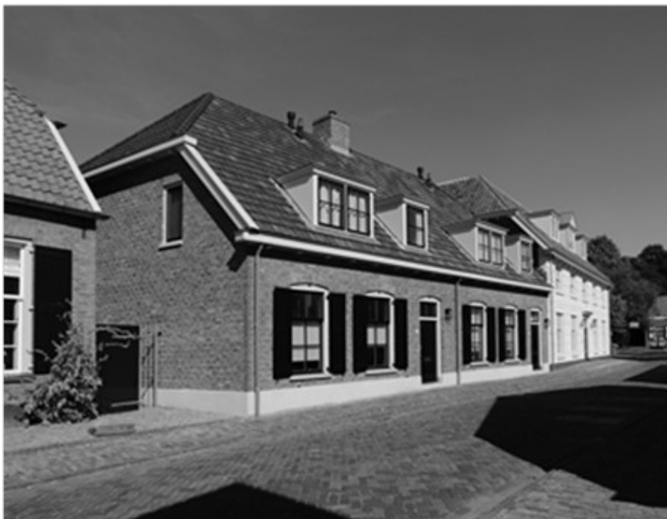
De door de Hegeman Bouwgroep gerealiseerde nieuwbouw in 2016.

Uiteindelijk lukte het na acht jaar, om er woningen te bouwen, die qua uitstraling helemaal passen in het historische deel van Borne. Deze nieuwbouw, die in 2010 gerealiseerd werd, bestaat uit twee woningen en 5 appartementen. De stenen en de pannen die van de twee gesloopte lage woningen kwamen, werden hergebruikt bij de bouw van de twee huizen. De stenen bleken indertijd nog te zijn gebakken in steenfabriek Scholten uit Borne. De ingang van de appartementen kreeg de oude omlijsting met de zandstenen neuten om het oorspronkelijke karakter te behouden (neuten: stenen onderstukken van stijlen). Het geheel wordt beschouwd als een enorme verbetering van het straatbeeld in Oud Borne.