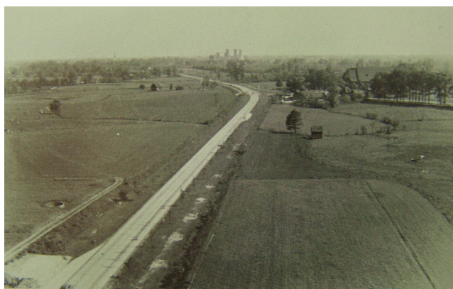
De kronkelige loop van de beek is met enige moeite nog terug te zien op deze foto.

Theresiakerk staat, splitste de beek zich. Het water dat uit de richting van Hengelo kwam ging grotendeels om Borne heen. Dat deel noemen we nu de Bornse Beek. Een smaller deel van de beek liep richting de Ennekerdijk, via de weilanden aan de zuidoostelijke rand van Borne, de Zuid Esch. Op een foto uit het boekje Borne en de Bornsen (7a) en op de kaart van Borne uit 1832 of 1900, is, met enige moeite, de kronkelige loop door de weilanden van de Zuid Esch te zien. De Zuid Esch was toen nog onbebouwd buitengebied. De Ennekerdijk was de oostgrens van het bebouwde Borne.