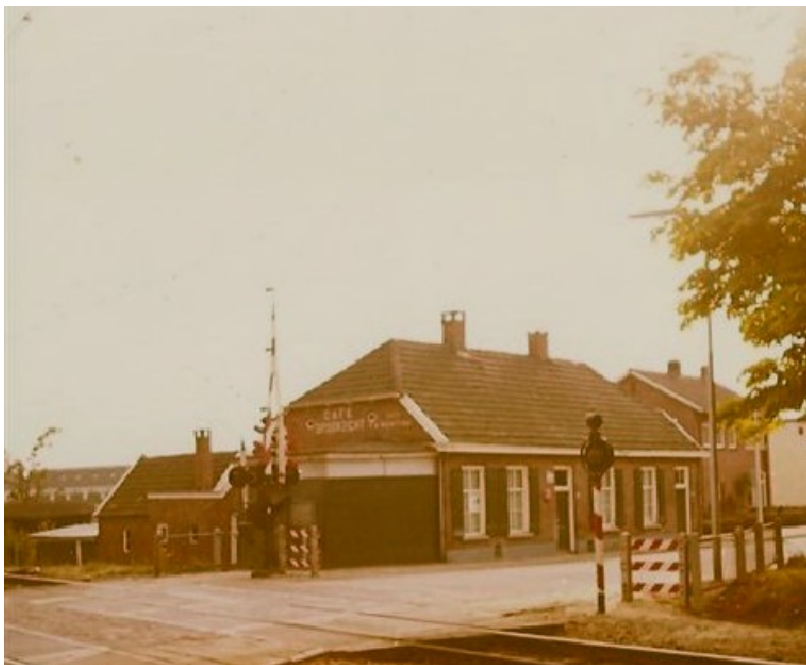
Cafe Mentink aan de Deldensestraat. Volgens overlevering hebben destijds werknemers van machinefabriek Ledeboer (gevestigd aan de overkant van de straat) een tunnel gegraven onder de straat door naar het cafe met medeweten van de kastelein. Dit als reactie op het besluit van Ledeboer om een grote muur langs de straat te laten metselen om zo clandestien drinken te voorkomen. Het ging de werknemers niet alleen om de drank maar ook om ontspanning want in die jaren (tweede helft van de negentiende eeuw) was er nauwelijks zoiets als een verenigingsleven.

Artikel uit De Tijd van 15 november 1902.