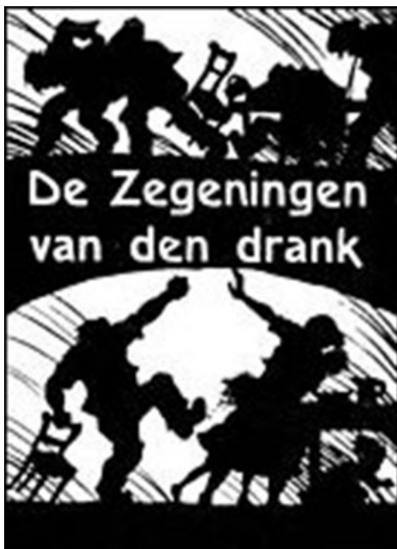
Pamflet dat waarschuwt tegen de gevolgen van drankmisbruik.