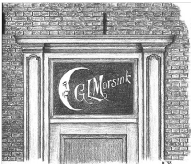
Bovenlicht ingang herberg.