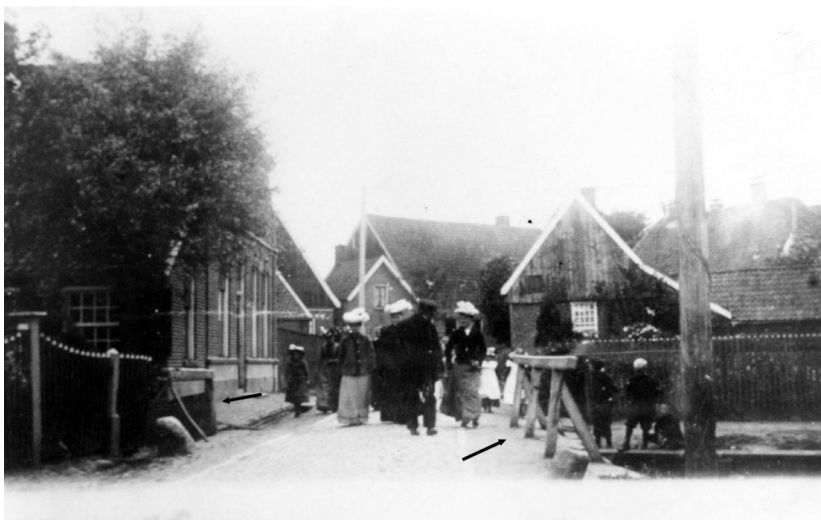
De Smitsbrug in de Nieuwstadsstraat. Links en rechts met pijlen aangegeven de brugleuningen. Links café 't Steerntje.

hield verband met de smid Hemmeler, die in het pand iets verder op, naast het Steerntje, werkte. In dat pand kwam veel later de ijzer- en gereedschaphandel firma Knoef. Een waardig opvolger, want ook ijzerwaren tenslotte. Nog weer later, tot voor kort, was er een modezaak in het pand. Helaas geen ijzeren harnassen. Inmiddels, medio 2016, staat het al weer te huur.