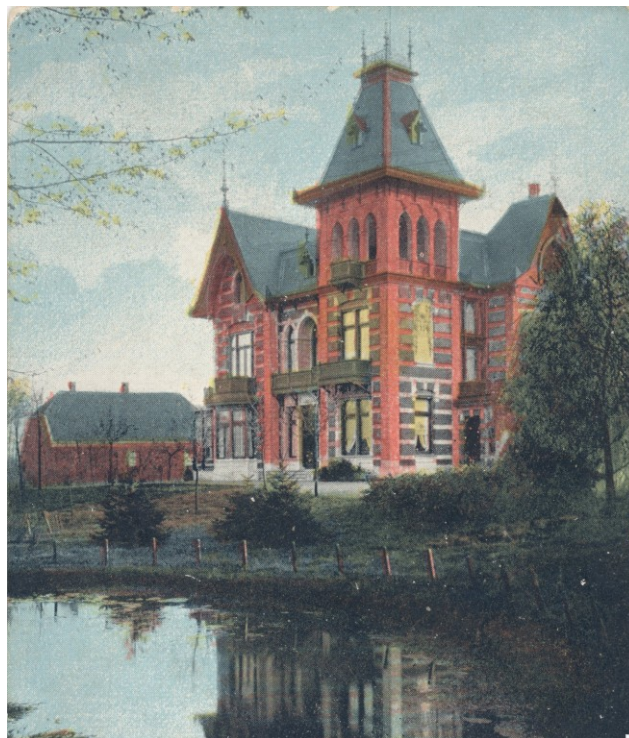
De vijver, eerder een deel van de Pietmanskolk.