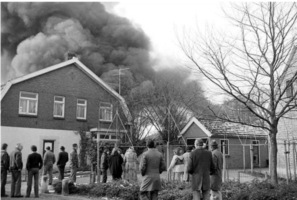
De brand in 1981.

Er werden plannen ontwikkeld om er nieuwbouw te realiseren. Maar voordat met de gemeente tot overeenstemming kon worden gekomen gingen vele jaren voorbij. Het dichtgetimmerde pand stond leeg en raakte in verval. De ramen werden dichtgetimmerd en het pand kreeg het aanzien van een bouwval. In 2002 sprak de buurt er met grote ergernis over als een ruïne en drong aan op sanering. De Hegeman bouwgroep wenste een bebouwing, passend in de stijl van Oud Borne en