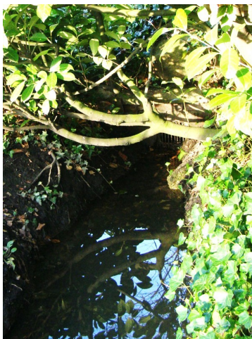
In een tuin tussen de Ennekerdijk en de Abraham ten Catestraat ligt bovengronds nog een klein stukje beek.

een tuin tussen Ennekerdijk en Abraham ten Catestraat kun je het kleine stukje dat nog over is van de oude Bornse Beek, via een rooster, ondergronds zien verdwijnen. Of eigenlijk is verdwijnen niet het goede woord: vanaf hier gaat de Bornse Beek ondergronds via een rioolbuizenstelsel richting het Kulturhus. Net zoals de oude beek via een rioolbuizenstelsel vanaf de Rondweg komt, tot voorbij de tuin van Galerie Polder.